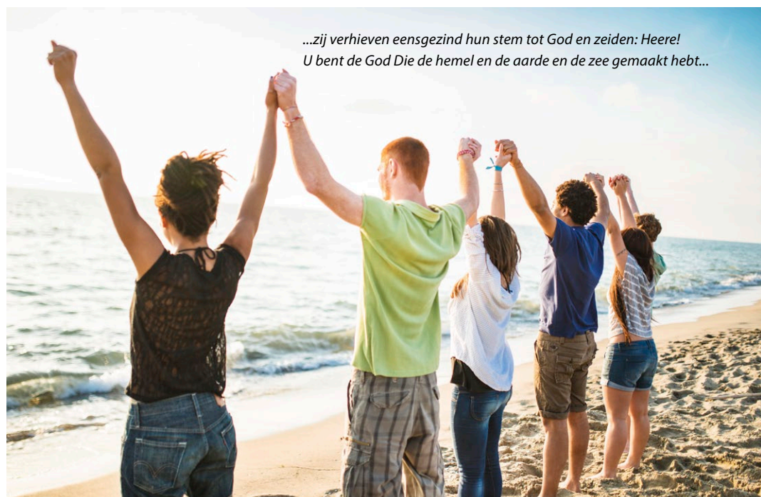
...zij verhieven eensgezind hun stem tot God en zeiden: Heere! U bent de God Die de hemel en de aarde en de zee gemaakt hebt...

de reeds 25 hoofdsteden die bezocht werden en waar geproclameerd werd dat Jezus Koning is. Er zijn nog 175 steden te gaan. De duivel is niet blij als we proclameren dat Jezus Koning is. Eeuwenlang heeft hij op aarde geregeerd en de volkeren geteisterd met zonde, ziekte en dood. Jezus kwam niet alleen om ons persoonlijk te verlossen, maar om alle volken terug te brengen onder Gods heerschappij van vrede en recht en eeuwige verlossing. De oorlog om alle volken is in volle gang. Als we belijden dat Jezus Koning is, is dit een rechtstreekse oorlogsverklaring aan Satan en zijn trawanten. Hij kan dit niet verdragen. Toch weet hij dat hij sinds Golgota een verslagen vijand is, die met alle macht probeert stand te